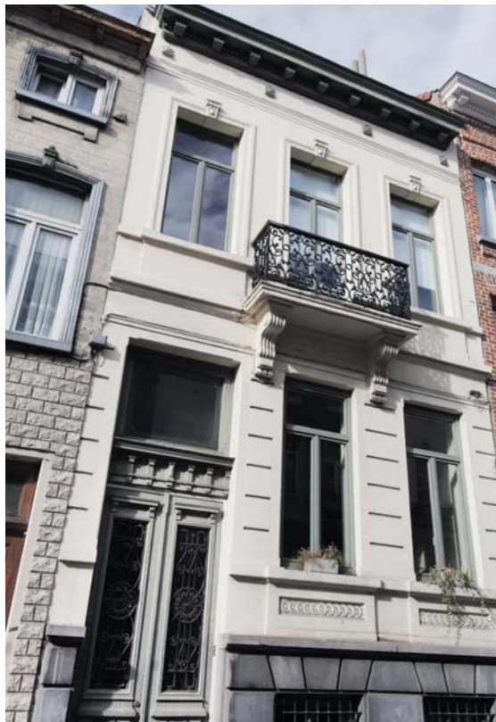
De dubbele voordeur moest ooit grandeur uitstralen.

‘Naarmate de verbouwing vorderde, werden heel wat ideeën verfijnd of aangepast’