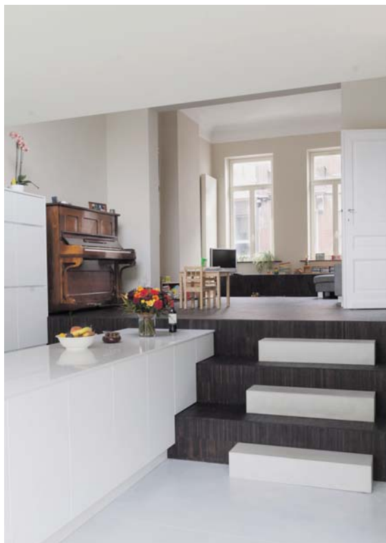
De trappen naar de aanbouw benadrukken de breedte van de woning.