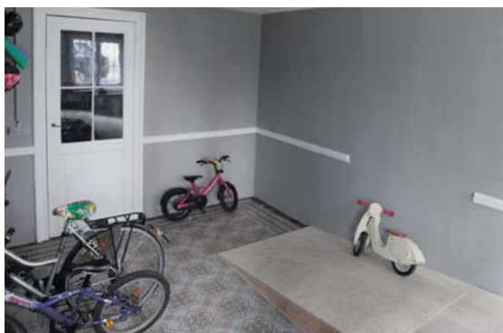
Een helling in de inkomhal leidt naar een praktische fietsenstalling.