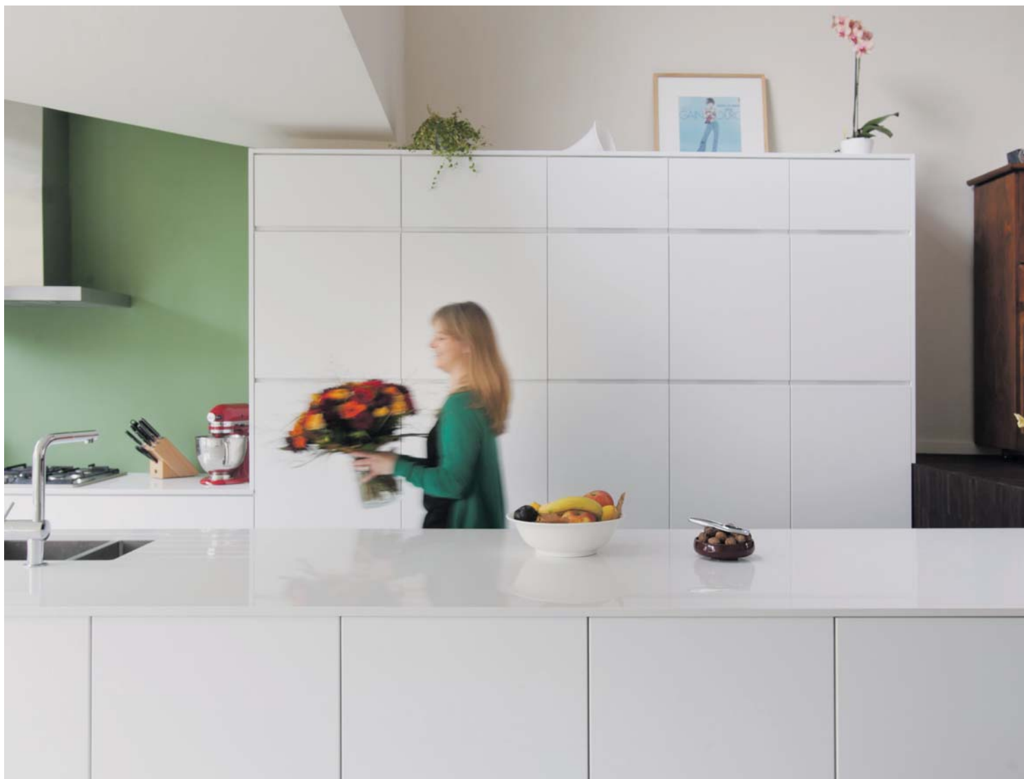
Het lage plafond in de keuken creëert intimiteit en een ideale akoestiek.